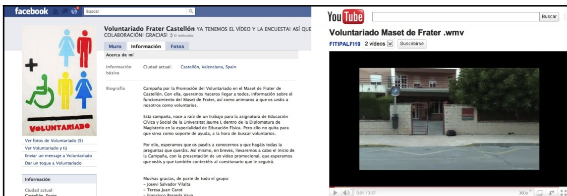
Facebook y vídeo de la campaña “Nos sumamos”