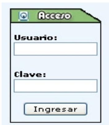
Figura 1. Acceso al área de los módulos.

El programa fue implementado en el aula de informática del centro. Las TIC han desempeñado un papel fundamental para la aplicación del programa. Cada alumno accedía a la página web del programa con su nombre de usuario y contraseña, la misma que le daba paso a las distintas actividades y a los módulos.