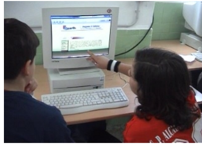
Foto 2. Alumnado español participante de la experiencia.

Las distintas actividades han tenido tanto un carácter individual como grupal.