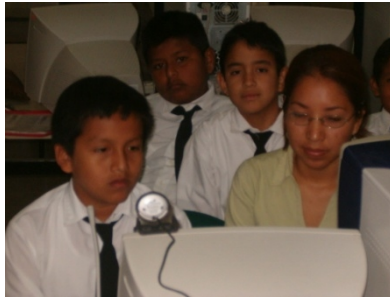
Foto 1. Alumnado ecuatoriano durante una videoconferencia (Santa Elena, Ecuador).